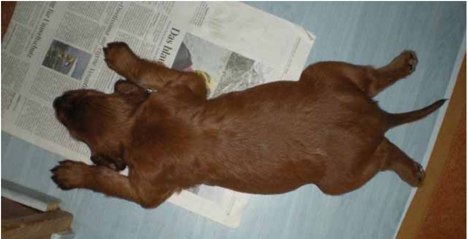
Perfektes "Red Gold of Saint George-Down" mit viereinhalb Wochen...